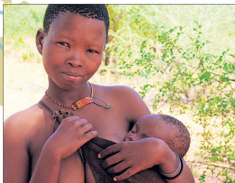
De Khoisan hebben een lichte huid en hoge jukbeenderen.

mensheid. Het wordt een kenmerk van een bepaalde aftakking. Wie een kenmerk deelt met iemand, deelt een voorouder: de persoon waarbij de mutatie in het Y-chromosoom of het mDNA het eerst is voorgekomen. De wereld kan worden onderverdeeld in groepen mensen die een reeks van dezelfde kenmerken delen. Zo'n groep wordt een 'haplogroep' genoemd. Haplogroepen en -subgroepen hebben namen als M, Q3 of R1A1. Een haplogroep is vaak verbonden aan een locatie: zo komt haplogroep U5 vooral voor in Scandinavië, met name in Finland.